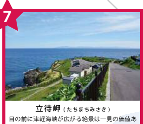
立待岬 (たちまちみさき) 目の前に津軽海峡が広がる絶景は一見の価値あり。道中には「石川啄木一族の墓」もある。