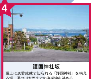
護国神社坂 頂上には恋愛成就で知られる「護国神社」を構える坂。湯の川方面までの海岸線を望める。