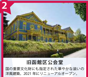
旧函館区公会堂 国の重要文化財にも指定された華やかな装いの洋風建築。2021年にリニューアルオープン。