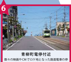
青柳町電停付近 数々の映画やCMでロケ地となった路面電車の停留所。晴れた日は特に写真映えがする。