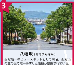
八幡坂 (はちまんざか) 函館随一のビュースポットとして有名。函館山の麓の坂で唯一すりすり階段が整備されている。