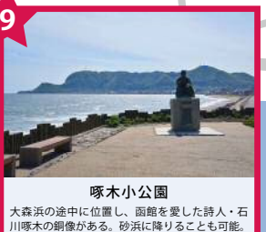
啄木小公園 大森浜の途中に位置し、函館を愛した詩人・石川啄木の銅像がある。砂浜に降りることも可能。