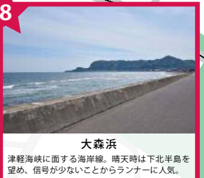
大森浜 津軽海峡に面する海岸線。晴天時は北半島を望め、信号が少ないことからランナーに人気。

5KM コース ともえ大橋で景色を楽しもう! 函館湾沿いに架かる全長1,924mの幹線道路。主にトラックや通勤車が多く往来する橋ですが、広めの歩道が設けられていることや信号が無いことから、函館市民のランニング・ウォーキングスポットとしても人気です。