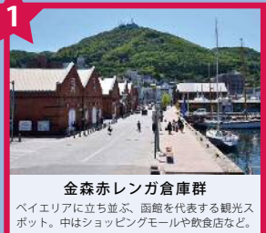
金森赤レンガ倉庫群 ベイエリアに立ち並ぶ、函館を代表する観光スポット。中はショッピングモールや飲食店など。