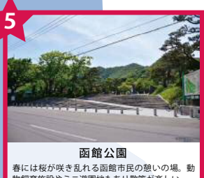
函館公園 春には桜が咲き乱れる函館市民の憩いの場。動物飼育施設やミニ遊園地もあり散策が楽しい。