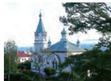
函館ハリストス正教会