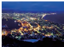
函館山からの夜景

美しい港街・函館で、別荘に訪れるようにのんびりと。あなただけのロングステイをはじめませんか。