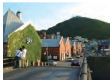
金森赤レンガ倉庫