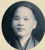
川田龍吉 男爵 1856-1951